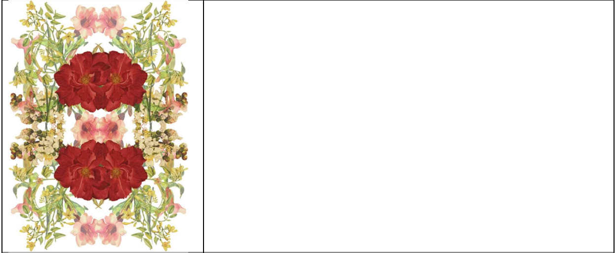
ตารางที่ 3 วิเคราะห์รูปแบบลวดลายพันธุ์ไม้ในวรรณคดี

ลวดลายสร้างสรรค์ที่ได้รับแรงบันดาลใจมาจากกลุ่มพันธุ์ไม้ในวรรณคดี ลวดลายธรรมชาติ ได้แก่ ดอกไม้และใบไม้ที่ผสมผสานกันหลากหลายชนิด กับโครงสร้างลวดลายเรขาคณิตของสี่เหลี่ยมจัตุรัสที่นำมาเรียงซ้อนกันจนเกิดเป็นลายชั้นที่สองด้านหลัง มีองค์ประกอบหลักเป็นรูปดอกไม้แบบกลีบมกล และกลีบหยัก เชื่อมต่อกันด้วยใบไม้ขอบหยัก เถาไม้ที่เรียงต่อกันเป็นเส้นนำสายตา ต่อเข้าหา ดอกอื่นๆ มีการใช้ลักษณะของตัวลายดอกหลายขนาดแตกต่างกัน ระยะเวลาของแต่ละดอกแตกต่างกัน การวางลายต่อหนึ่งช่องลายค่อนข้าง แน่น เห็นพื้นหลังน้อย แต่ทั้งระยะห่างระหว่างช่องลายมากกว่า ใช้ลวดลายเรขาคณิต ออกแบบเป็นกรอบนำสายตา วางตามแนวพื้นที่ ด้านหลังของช่องลาย เพื่อเติมเต็มพื้นที่ว่างและเพิ่มรายละเอียดของลายให้มีความทันสมัย ใช้หลักสมดุลแบบสมมาตรตามแนวตั้ง ด้วยการ ซ้ำแบบเท่ากัน ใช้ลวดลายแบบธรรมชาติเป็นหลัก ลวดลายเรขาคณิตเป็นรอง ใช้สีโทนร้อน ได้แก่ สีส้ม, สีเหลือง, สีแดง, สีชมพู สีม่วงแดง ตัดกับสีโทนเย็น ได้แก่ สีเขียว, สีเขียวอ่อน โดยให้น้ำหนักของสีร้อนและเย็นในปริมาณที่เท่ากัน ใช้สีชั้นที่ 2 คือสีน้ำตาล และสีครีม ช่วยในการเชื่อมโยงเข้าหากัน